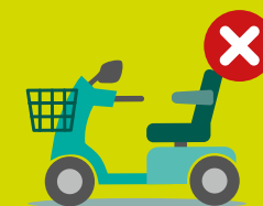
Geen fietsen en scootmobielen